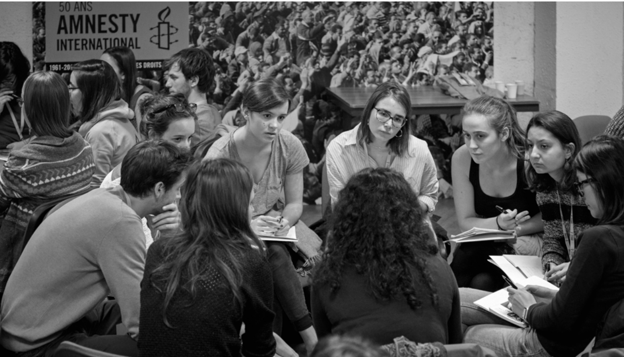
Week-end des antennes Jeunes, Paris 2017

Nous tenons à remercier très chaleureusement l'ensemble des premiers donateurs bienfaiteurs qui ont choisi de nous faire confiance et de donner à notre jeune fondation les moyens de se lancer. En 2017, vous étiez 406 à nous faire confiance. Grâce à vous, la Fondation Amnesty International France a pu soutenir des actions concrètes et locales d'éducation aux droits humains en France. Ensemble, construisons une société plus juste et respectueuse de chacun, en mettant les droits humains au cœur de la conscience collective.