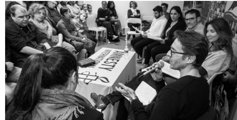
Conférence La question migratoire en milieu rural, Nevers 2017.