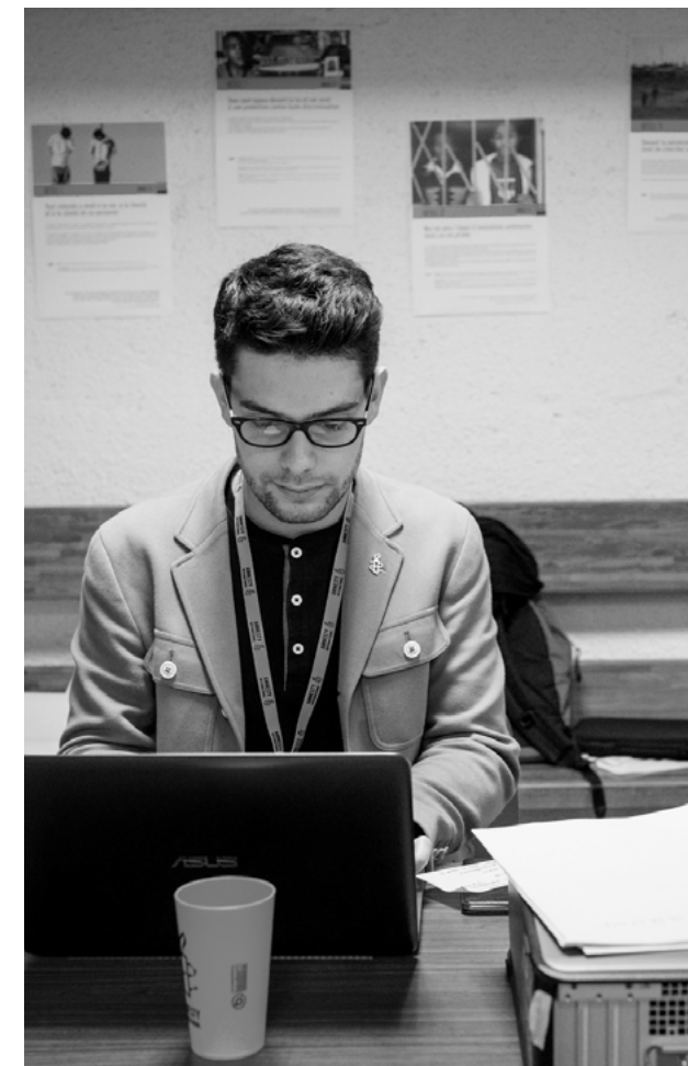
Week-end des antennes Jeunes, Paris 2017