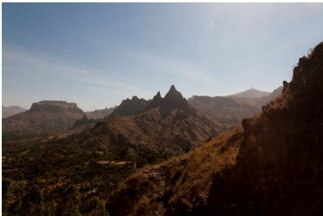
Les montagnes du Djebel Marra près de Dursa, dans le centre du Darfour (Soudan), mars 2015.